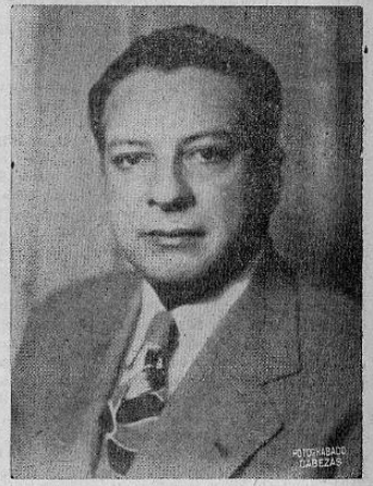
Excmo. Señor Embajador de Panamá en Costa Rica Don GIL BLAS TEJEIRA

Será el próximo jueves 3 de Noviembre día de gratas emociones para el culto y simpático hermano pueblo panameño con motivo de festejar en él su Fiesta Nacional.