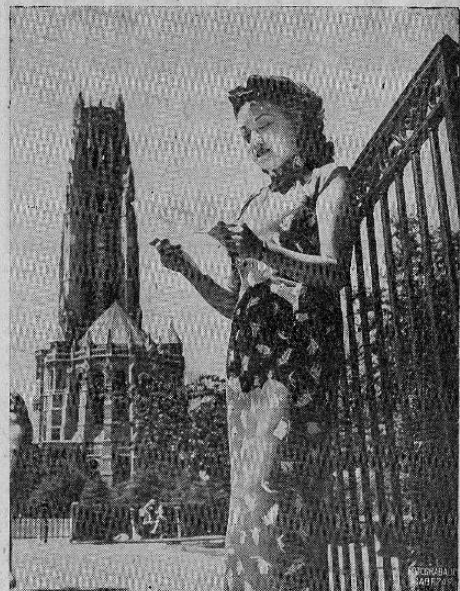
El grabado muestra a una estudiante de nacionalidad china en la Casa Internacional de Nueva York, leyendo una carta que recibió de su familia. Al fondo de la fotografía se ve la Iglesia de Riverside, que ve al Río Hudson