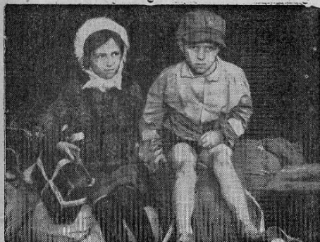
Huérfanos de la guerra, estos hermanos van camino de un nuevo hogar proporcionado por la Organización Internacional para Refugiados de la ONU. Millares de otros niños fueron auxiliados y luego reunidos con parientes mediante la labor de la OIR.