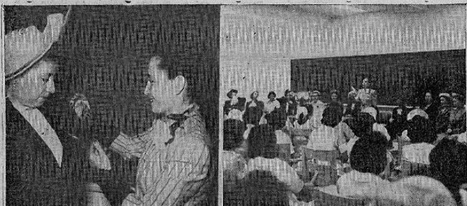
Instantes en que era condecorada por la Universidad Femenina de México, la primera dama de Guatemala, doña Elisa Martínez de Arévalo, en homenaje a su brillante labor de protección a la infancia

Doña Elisa Martínez de Arévalo, profesora argentina, contraído matrimonio con el Doctor Juan José Arévalo, cuando este maestro guatemalteco se encontraba en la República del Plata, efectuando es